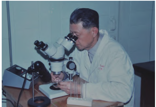
图4 庄先生1980年在上海细胞生物研究所亲自做实验

庄先生不光学术成就斐然, 更为重要的是他广阔的视野和全局观。1954年《中国实验生物学杂志》复刊, 并改名为《实验生物学报》, 庄先生被委以主编的重任, 之后的几十年中, 他克服种种困