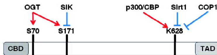
Fig.1 The structure of CRTC2.

鉴于CREB在许多生理现象中起到至关重要的作用,作为CREB转录必须的辅激活因子,CRTC自身的调节机制受到广泛关注和探索。其中以CRTC2在肝细胞中的调节分子机制被研究地最为清晰。在肝细胞中处于未激活状态的CRTC2持续地被激酶SIK磷酸化,并与14-3-3蛋白结合从而被隔离在细胞